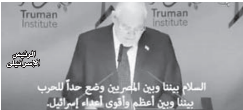
الرئيس السيسى السلام بيننا وبين المصريين وضع حداً للحرب بيننا وبين أعظم وأقوى أعداء إسرائيل.