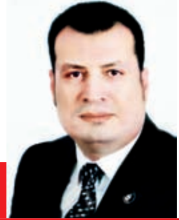
سيد سعيد يكتب:

لا ينكر عاقل في هذا الكون أن ما جرى للمصلين في واقعة المسجدين بإحدى مدن نيوزيلندا، والتي راح ضحيتها ٥٠ مسلماً وإصابة آخرين، أثناء تأديتهم للصلاة، كان بمثابة صدمة، تجاوزت في مضمونها كافة الشعارات وخطابات التهديد التي صدرت هنا وهناك، أيضاً تجاوزت حدود المكان والزمان، وفتحت الباب على مصراعيه أمام انتقادات حادة لأساليب لا تقل في بشاعتها عن الجريمة الإرهابية ذاتها، المقصود استغلال الجرائم الإرهابية في مزاد المتاجرة السياسية من أطراف، دأبت على إطلاق التصريحات الجوفاء أمام الميكروفونات والكاميرات، وسرعان ما يتلاشى صداها ويتوارى بريقها. الصدمة عبرت عنها كل وسائل الإعلام المرئية والمسموعة والمقروءة، فقد باتت الحادثة الإرهابية البشعة العنوان الأبرز في الفضاء الإلكتروني، وأصبحت تحتل موقع الصدارة «تريند»