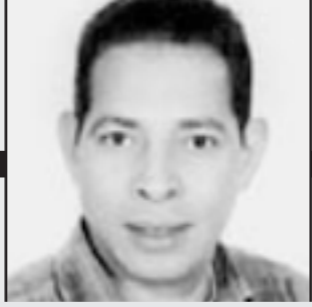
محمد عبد اللطيف يكتب:

لا أحد مهما بلغت براعته في القفز على المنطق، يستطيع أن يقف عائقاً أمام الدفاع عن حقوق الإنسان، وفي المقابل ليس بمقدور أحد مهما بلغت درجة مجافاته للحقيقة، إنكار أن المنظمات الحقوقية ليست سوى أبواب لخلفية تتيح لأجهزة الاستخبارات، التدخل في شؤون الدول، وابتزاز حكوماتها تحت لافتة براقة، ظاهراً نبيل وإنساني، أما باطنها فيحمل الخراب ونشر الفوضى، بهدف تمكين جماعات وتنظيمات عميلة من السيطرة على مقاليد الحكم.