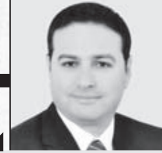
محمد طراييه يسأل:

السيسى: «الناس بتقول لي عاوزين حق أولادنا ودمهم»