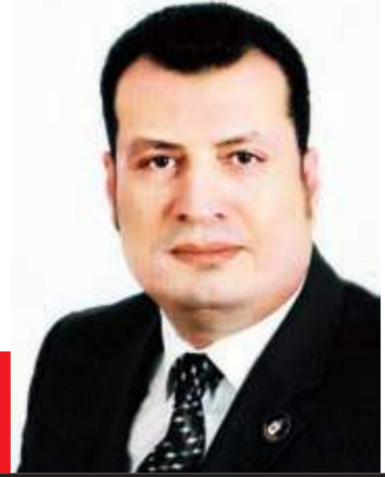
سيد سعيد يكتب:

بأذرعها الموائية لها، أو حاملة بالخلافة مثل تركيا، التي بدأت فعلياً تعزيز تواجدتها العسكري لتطويق المنطقة بأكملها من الشمال الشرقي حيث سوريا والعراق، مروراً بتدخلها في الشمال الأفريقي حيث تونس وليبيا، كما تسعى لترسيخ تواجدتها بالتأثير على الأرض، عبر دعمها خلايا تنظيم الإخوان في البلدان العربية، لإحياء مشروعها الوهمي الذي يمثل أجندة إخوانية بالأساس.