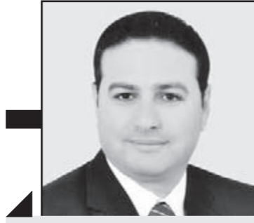
محمد طراييه يكتب:

فتح المجال للحريات المسؤولة وليست المنفلتة سيكون خطا الدفاع الأول للنظام والحكومة ضد أكاذيب الإخوان