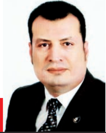
سيد سعيد يكتب:

بدون مقدمات.. القضية من فرط خطورتها لا تحتمل ترف «تزويق» العبارات، أو الوقوف في المنطقة الرمادية بين الأبيض والأسود، لأنها تخص العقيدة الدينية والهوية الوطنية، بل كافة أمورنا الحياتية، ولندخل في الموضوع مباشرة.. إن تطوير الخطاب الديني ضرورة ملحة، لا يمكن لأي عاقل إغفالها أو التهوين من أهميتها، لكن العبث بثوابت الدين عبر محاولات تطويع الآيات القرآنية الصريحة، لركوب موجة بغیضة، أو بغرض تمرير أمور في غير موضعها، أكبر من جريمة في حق الدين وحق الأمة على حد سواء.