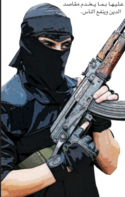
التوزيع مؤسسة الأهرام

القضية لم تكن بعيدة بحال من الأحوال عن اهتمام