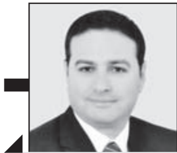
محمد طرايه يكتب:

وافق مجلس الوزراء برئاسة المهندس شريف إسماعيل رئيس مجلس الوزراء يوم الأربعاء الماضي على تنفيذ استراتيجية تطوير منظومة التعليم ما قبل الجامعي، والتأكيد على أن يبدأ التطبيق في سبتمبر المقبل. وأشار الدكتور طارق شوقي وزير التربية والتعليم والتعليم الفني، إلى أن الاستراتيجية تهدف إلى معالجة التحديات التي تعاني منها منظومة التعليم في مصر، والنهوض بهذه المنظومة وتطوير كافة عناصرها وتزويدها بالوسائل اللازمة لتحسين جودة التعليم في ظل التطورات المتلاحقة لنظم التعليم والتكنولوجيا بما في ذلك تطوير أداء المعلمين بما يحقق التجديد المعرفي والمهني لهم، وكذا التحول إلى نمط التعلم القائم على المعرفة والابتكار، من خلال مصادر متنوعة لتحسين مخرجات المنظومة التعليمية.. وقد وجه رئيس مجلس الوزراء وزارة التربية والتعليم بإعداد تقرير يتضمن تفصيل التكلفة السنوية المطلوبة، كما وجه بقيام وزارة الاتصالات بمراجعة عملية تطوير شبكة الاتصالات بفرض المتابعة والتحقق من جودة الخدمة المقدمة بنحو ٢٠٠٠ مدرسة.