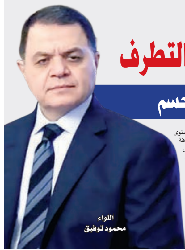
اللواء محمود توفيق

احترام حقوق المواطن ثوابت لن تتغير ← الأمن رسالة والعنف سيقابل بكل حدة وحسم