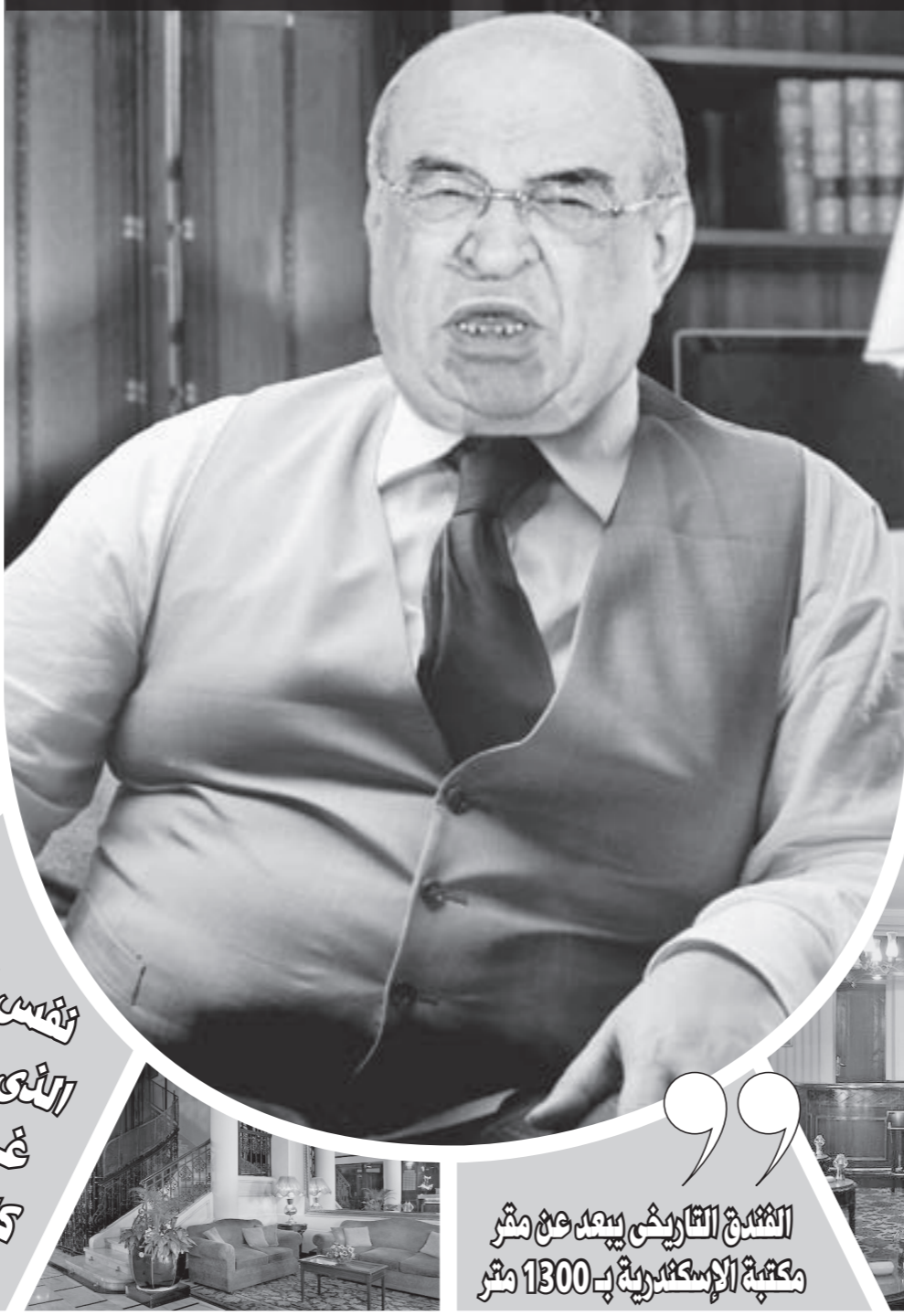
الشندق التاريخى بمرکز الإسكندرية بـ 1300 متر