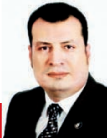
سيد سعيد يكتب:

يدرك المصريون بمسئولية مخاطر الفوضى على مستقبل هذا البلد، وبفلس المسؤولية يقفزون على الغضب المشروع من القرارات الحمقاء التي تدهس بعنفوان ما تبقى لهم من قدرة على تلبية الضغوط الحقيقية، ومن واقع هذا الإدراك وتلك المسؤولية فشلت المحاولات الرامية على التحريض بهدف الحشد لإثارة الفوضى عبر التظاهر ضد الغلاء، فهم يعلمون أن تلك الدعاوات، لن تحل الأزمات الاقتصادية، ولن تحقق أحلام الفئات الفقيرة، ممن يمثلون الغالبية العظمى داخل المجتمع المصري، لكنها ستزيد الأمور تعقيداً وسوءاً، وربما تنسف تماماً ما نعتمد عليه من موارد ضئيلة، خاصة إذا نظرنا إلى الواقع من