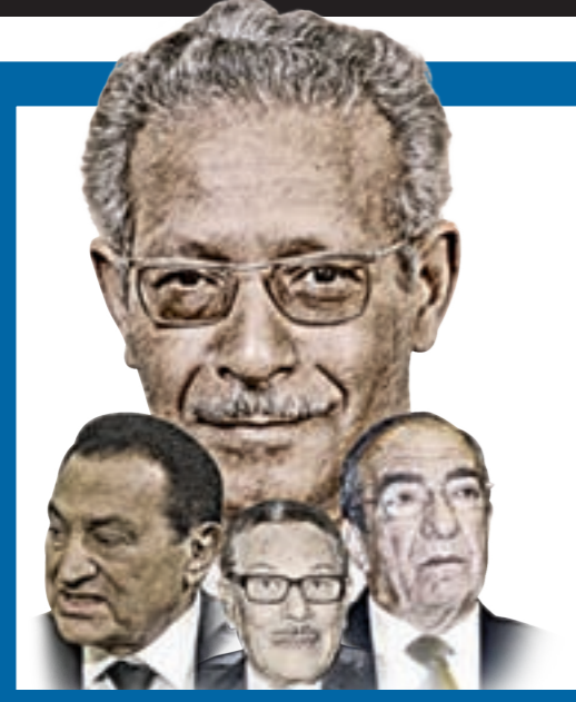
خفايا تورط «مبارك» و«عزمي» في اغتيال رفعت المحجوب

أدلى بها أمام المدعى العسكري الليبي بحضور شخصيات مصرية رفيعة المستوى